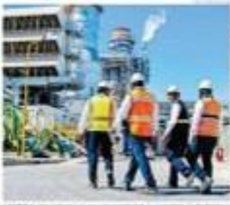
Trabajadores en una instalación de energía eléctrica en un proyecto de infraestructura.

El consumo de energía eléctrica en el Estado de Baja California Sur (BC) durante el verano de 2014, se incrementó en un 58% con respecto al mismo periodo del año anterior. Este aumento se debe a la demanda de energía eléctrica por parte de los usuarios, así como a la operación de la nueva Central de Ciclo Combinado (CC) que representa el 20% de la demanda que requiere BC. El consumo de energía eléctrica en el Estado de Baja California Sur (BC) durante el verano de 2014, se incrementó en un 58% con respecto al mismo periodo del año anterior. Este aumento se debe a la demanda de energía eléctrica por parte de los usuarios, así como a la operación de la nueva Central de Ciclo Combinado (CC) que representa el 20% de la demanda que requiere BC.