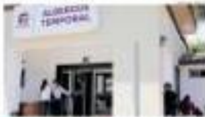
El DIF atiende a los menores a su cargo no localizados en el albergue temporal.

La CEDHBC revisa los protocolos del DIF para determinar cuándo sucede la falta que da origen a la falta de asistencia familiar a la familia, cómo se debe actuar y qué acciones se deben tomar para garantizar el bienestar de los menores a su cargo no localizados.